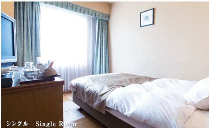
シングル Single Room

シンプルで清潔感のある内装がくつろぎを生み出すシングルルーム。 全室セミダブルベッドを使用しております。