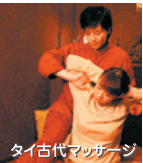
タイ古代マッサージ