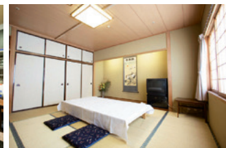
少人数での会席や商談などに便利な和室