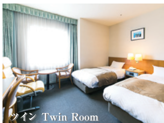
ツイン Twin Room

大きな窓からたっぷりの自然光が入る、 最上階にあるダブルルーム。 静かなひとときを満喫していただけます。