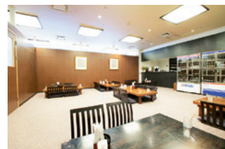
サウナレストラン