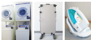
コインランドリー スズボンプレスナー アイロン