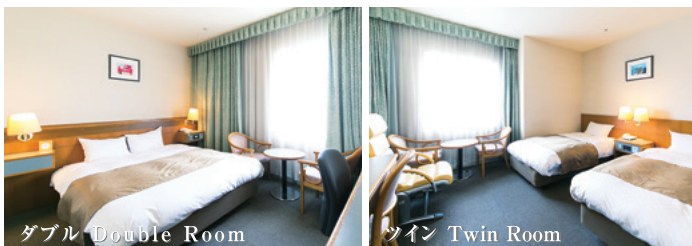
ダブル Double Room

シンプルで清潔感のある内装がくつろぎを生み出すシングルルーム。 全室セミダブルベッドを使用しております。